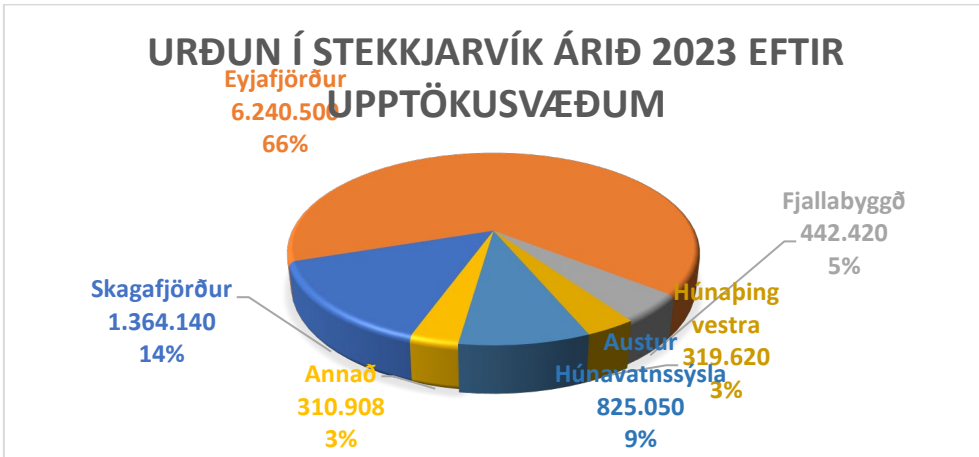
Mynd 3. Á myndinni kemur fram upptökusvæði og magn úrgangs til urðunar á fyrri helmingi árs 2023.

Umræður fóru fram á fundinum um að leggja klæðningu á heimreið að urðunarsvæði, alls um 1 km. Stjórn felur Elvari Bjarka að vinna áfram að málinu í samræmi við umræður á fundinum og veitir honum jafnframt heimild til þess að leita samninga við verktaka við Þverárfjallsveg varðandi lagningu klæðningar á umræddum vegarslóða.